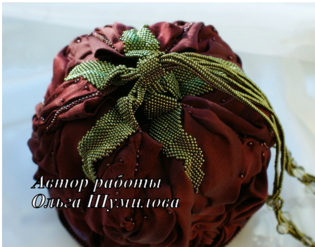
Автор работы Ольга Шумилова