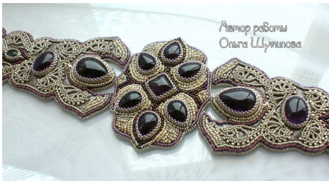
Автор работы Ольга Шумилова