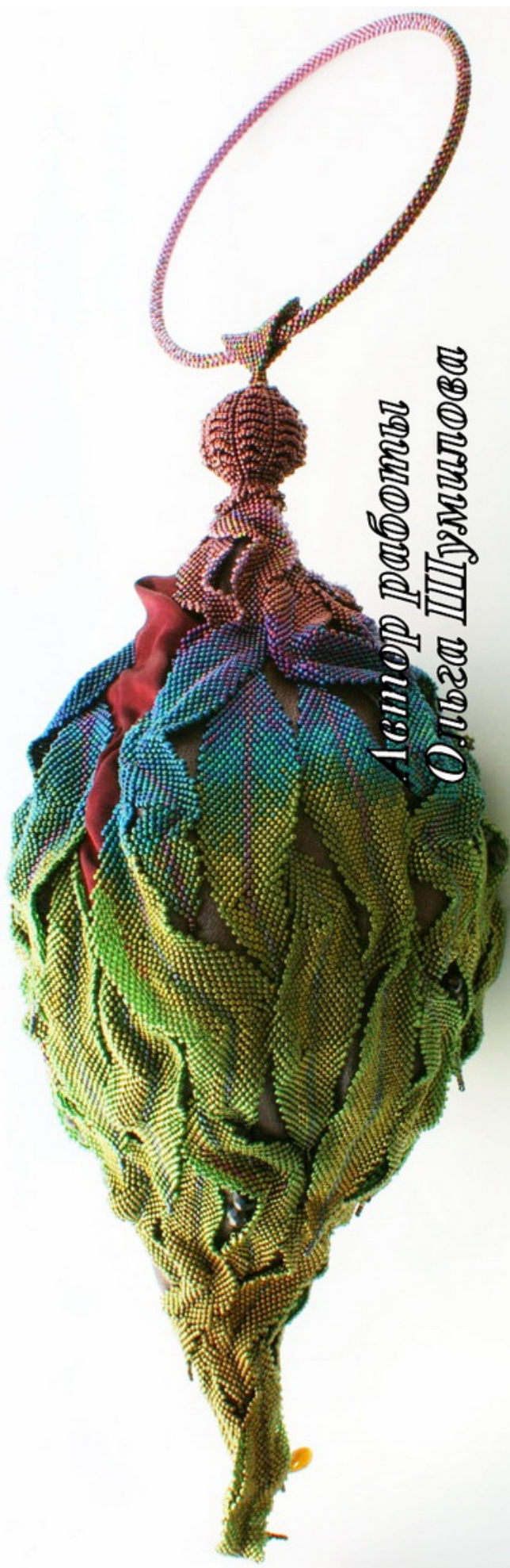
Авторы работы Ольга Шушупова